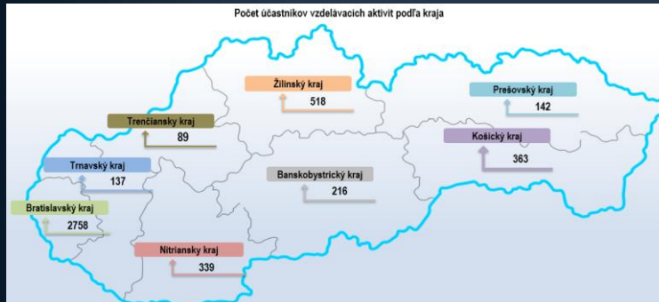
Počet účastníkov vzdelávacích aktivít podľa kraja

Druhá časť hlavnej aktivity národného projektu bola zameraná na zriadenie CAF centra ako jedného z mnohých centier podobného charakteru, ktoré v Európe v uplynulých rokoch vznikli. Od svojho vzniku sa CAF centrum okrem iných aktivít začalo venovať aj poskytovaniu vzdelávania, pričom tieto vzdelávacie aktivity mali celoslovenský dosah.