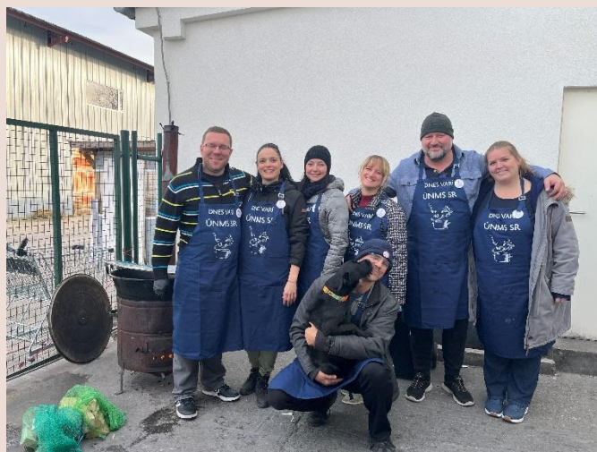
Varenie kapustnice v nocľahárni Depaul – 06.11.2024