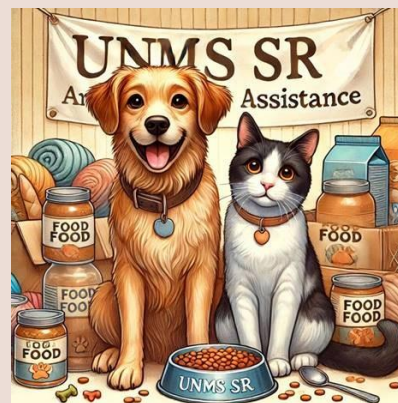
Labková patrola – pomoc spoločenským zvieratám