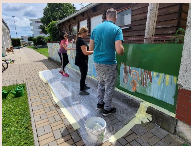
Zveľadovanie detského ihriska Materskej školy v Dunajskej Lužnej – 23.05.2024