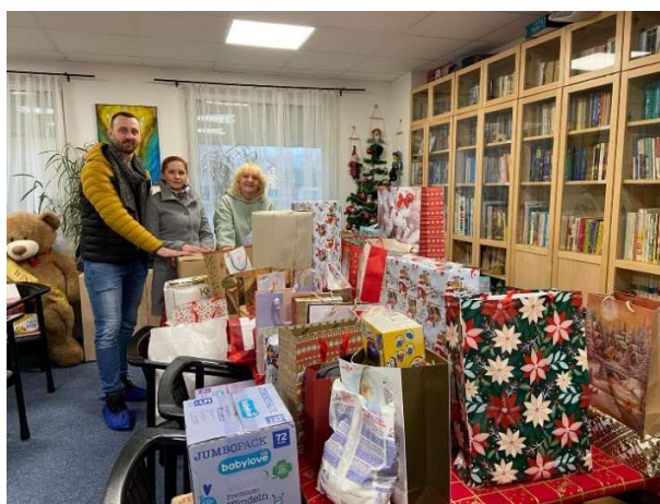
Fotografia z odovzdávania darčiekov od zamestnancov ÚNMS SR pre deti a mamičky v azylových centrách.